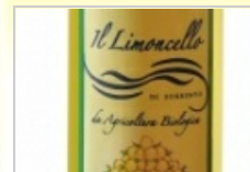
Biologico - Il...